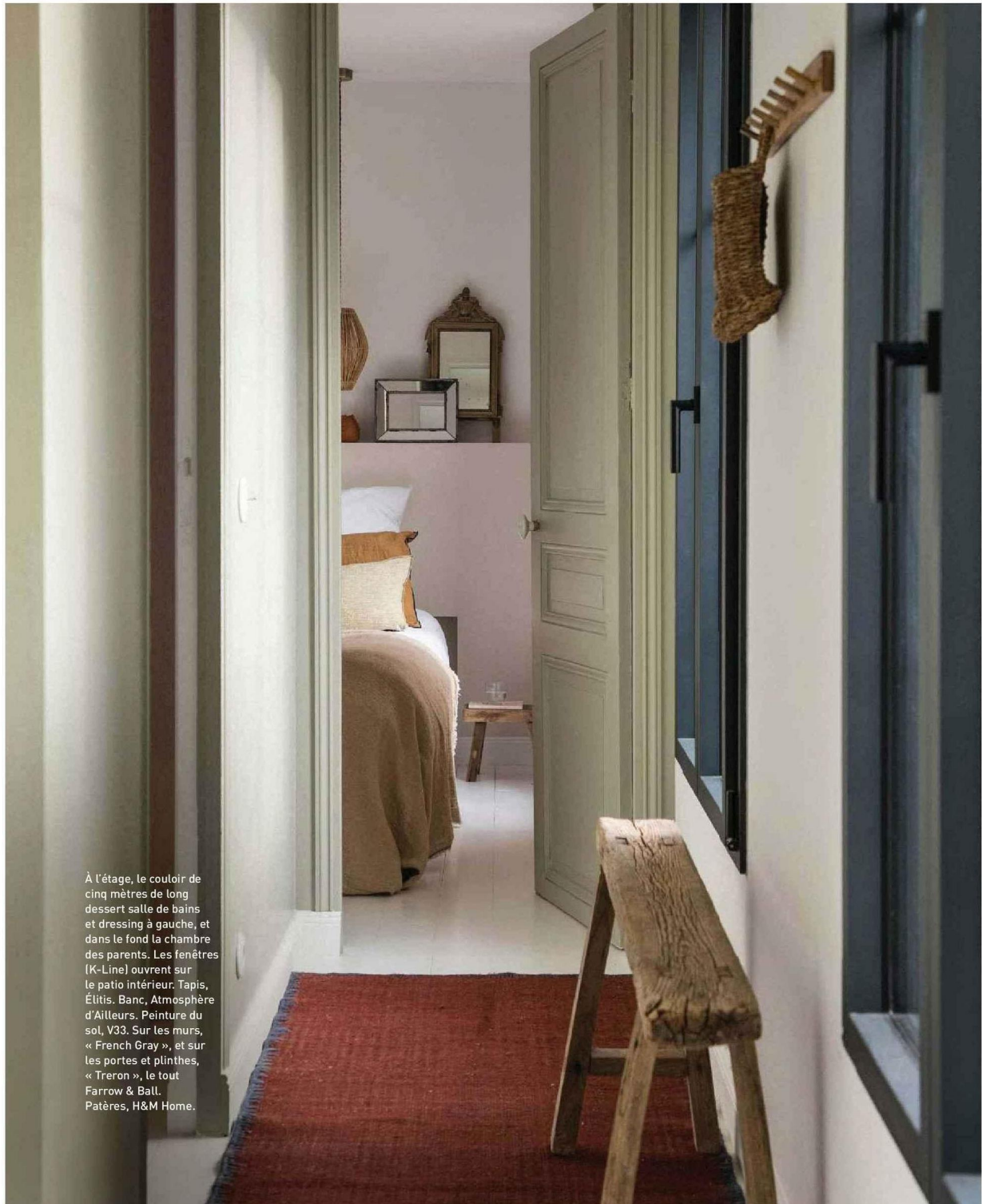
À l'étage, le couloir de cinq mètres de long dessert salle de bains et dressing à gauche, et dans le fond la chambre des parents. Les fenêtres (K-Line) ouvrent sur le patio intérieur. Tapis, Élitis. Banc, Atmosphère d'Ailleurs. Peinture du sol, V33. Sur les murs, « French Gray », et sur les portes et plinthes, « Treron », le tout Farrow & Ball. Patères, H&M Home.