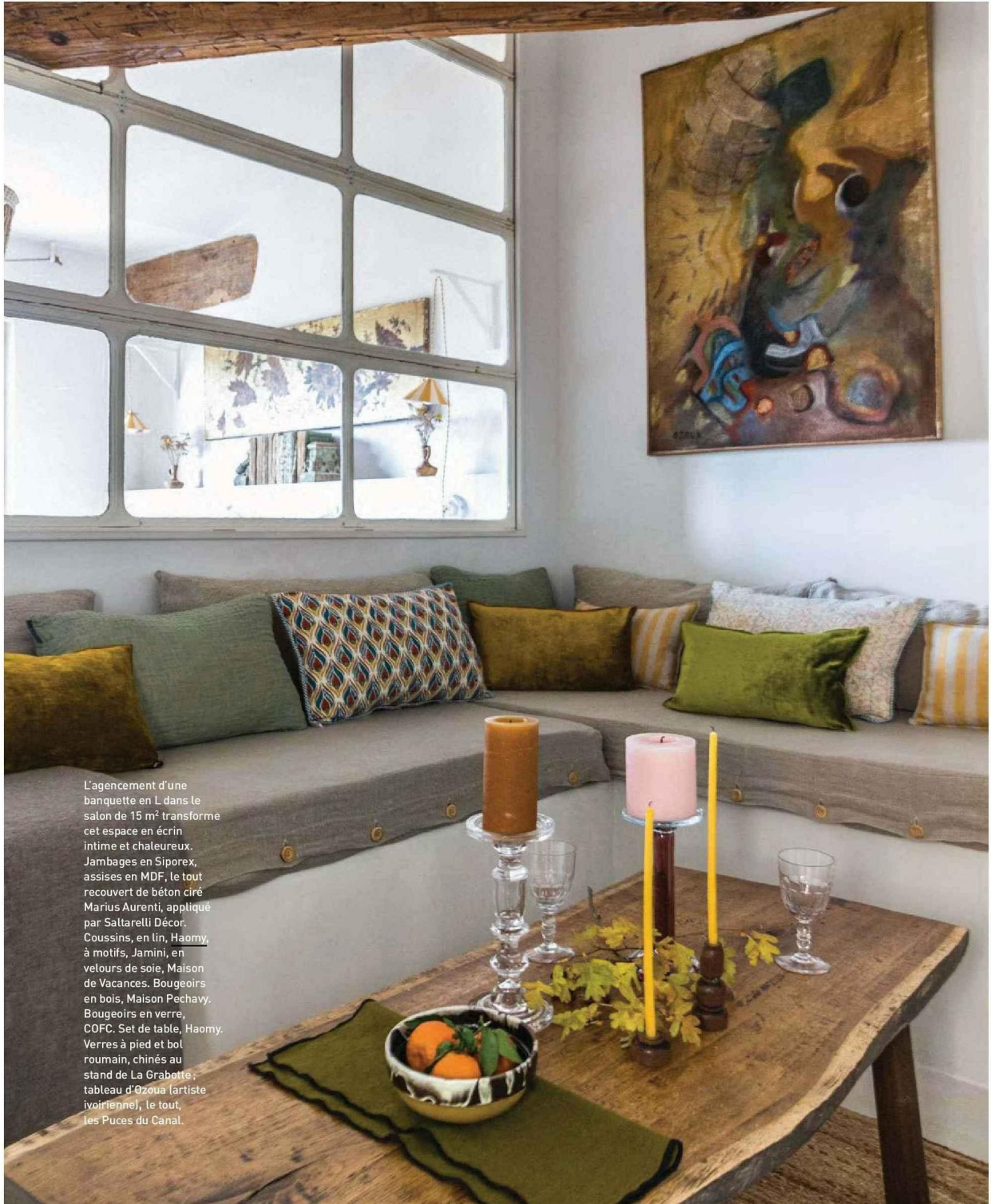
L'agencement d'une banquette en L dans le salon de 15 m 2 transforme cet espace en écrin intime et chaleureux. Jambages en Siporex, assises en MDF, le tout recouvert de béton ciré Marius Aurenti, appliqué par Saltarelli Décor. Coussins, en lin, Haomy, à motifs, Jamini, en velours de soie, Maison de Vacances. Bougeoirs en bois, Maison Pechavy. Bougeoirs en verre, COFC. Set de table, Haomy. Verres à pied et bol roumain, chinés au stand de La Grabotte ; tableau d'Ozoua (artiste ivoirien), le tout, les Puces du Canal.